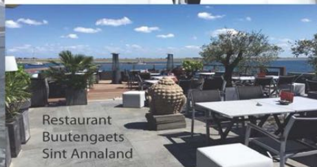
Restaurant Butengaets Sint Annaland